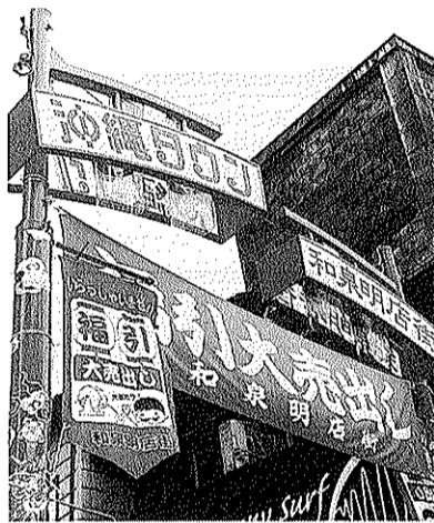
商店街入口の朱色のアーチ

商店街自体を省みると、まず業種不足が問題点として挙がる。パン・文具・書籍など必須の商品を扱う店が既に撤退。近隣の商店街や大型店に客を奪われるのは必然である。併せて、土日は客が来ないものと考えて、日曜